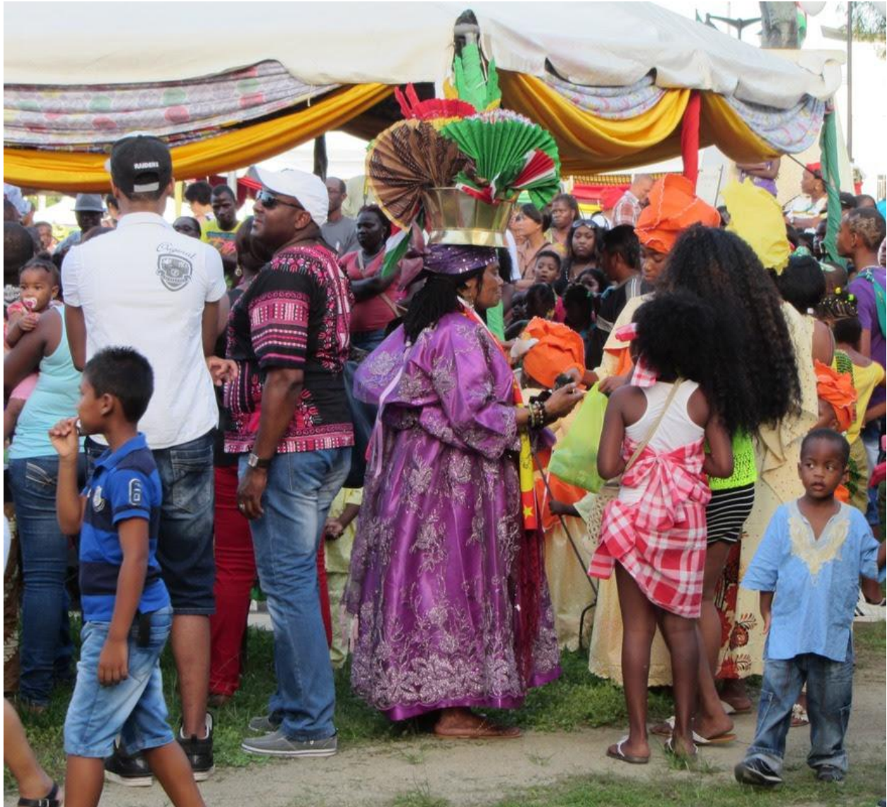
Podemos encontrar varias culturas en el mercado de la capital

El Beato Pedro Donders practicó allí las siete obras de misericordia clásicas de una manera excepcional, visitando esclavos y trabajando con leprosos en Batavia, una ciudad en Suriname.